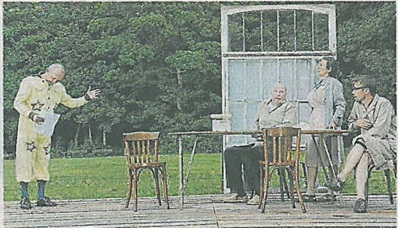
« Le Schpountz » de Marcel Pagnol, version belge avec la Compagnie Marius.

Les cinq comédiens interprètent les trente-quatre rôles dans un décor naturel, le public sort heureux d'une